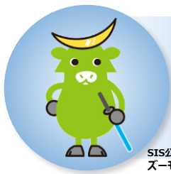
SIS公式キャラクター スーモ